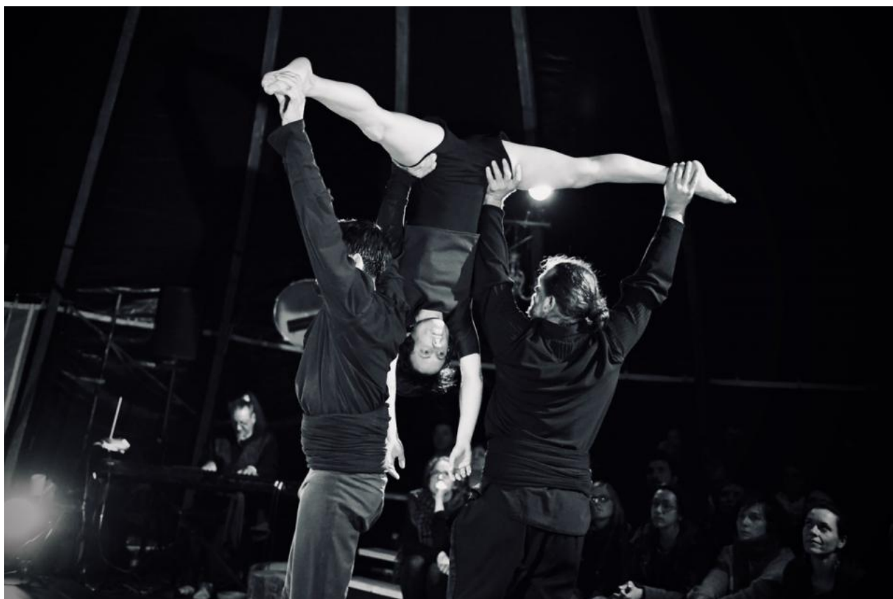
Inscenace Strach v podání souboru Théâtre d'Un jour

naučit. Pak mi trvalo dvacet let, než jsem pro realizaci inscenace založené na párové akrobacii našel ten správný tým. Tři akrobaté, kteří v inscenaci vystupují, jsou původně ze souboru XY, což je soubor s dlouholetou tradicí, která je založená na párové akrobacii a soudržnosti kolektivu. Skrze hudbu, zpěv a akrobacii chceme promlouvat o tom, že se nesmíme bát říkat pravdu, že nesmíme mít strach z toho být upřímní. My si to ještě můžeme dovolit. Ale na světě přibývá míst, kde lidé svobodně promlouvat nemohou. A na to bychom také rádi upozornili.