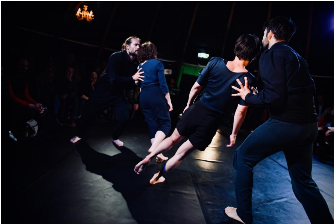
Inscenace Strach v podání souboru Théâtre d'Un jour

Jsou tedy těly, prostřednictvím nichž tento hlas promlouvá. A tento hlas se nechává slyšet. Je hlasem, který nesouhlasí s křivdami a bezprávím. Jsme přesvědčeni, že právě o tom bychom v současné době měli nahlas mluvit.